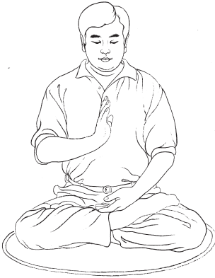
Đơn thủ lập chưởng Pháp Chính càn khôn Tà ác toàn diệt